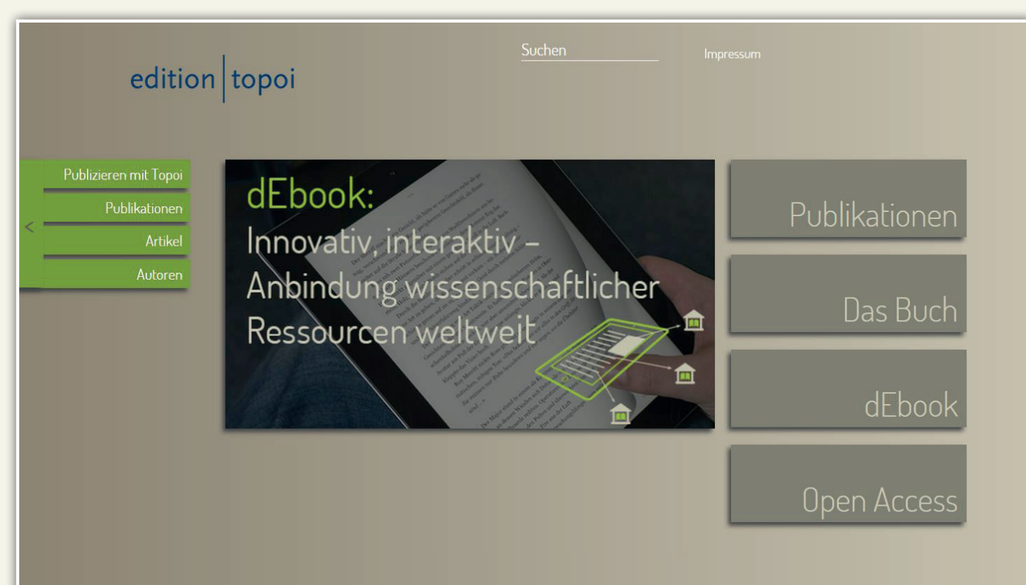
Startseite der Publikationsplattform Edition Topoi

Die von Topoi bereitgestellten Digitalisate und Publikationen können nach dem Prinzip des Open Access und auf Basis der Creative Commons-Lizenz 3.0 genutzt werden. Damit kommt Topoi der Verpflichtung nach, die mit öffentlichen Geldern erzielten Forschungsergebnisse rasch und in uneingeschränktem Zugriff zu veröffentlichen.