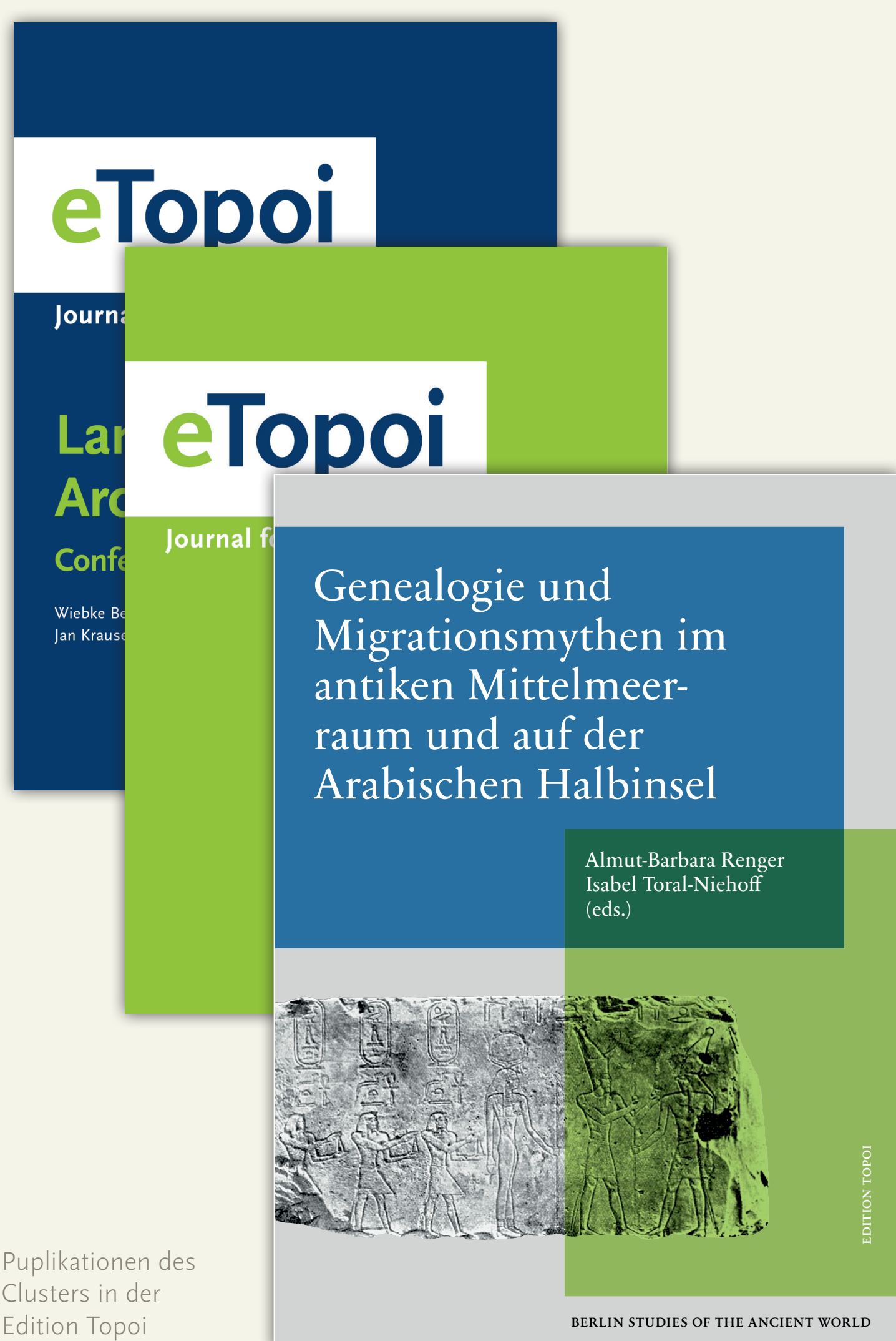
Publikationen des Clusters in der Edition Topoi