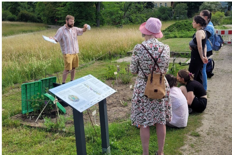
Modellbeet Pflanze KlimaKultur

Am Langen Tag der Stadtnatur zeigt der Botanische Garten, was es mit dem Projekt Pflanze KlimaKultur! auf sich hat. Teilnehmende gehen Forschungsfragen nach, inwieweit der Jahresablauf der Entwicklungsstadien von aus-gewählten krautigen Pflanzen das Stadtklima widerspiegelt.