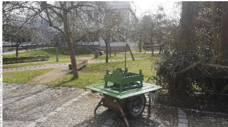
Verweile doch: Der Apfelwagen

Positive Zukunftsutopien zaubert die Gruppe Realutopien: Berlin Friedrichstraße Utopia 2048