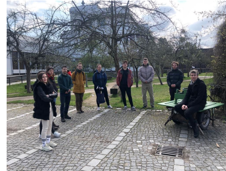
Die Seminarteilnehmende vor der Apfelwiese

MITMACHLABOR APFELWIESE: STUDIERENDE UNTERSUCHEN MÖGLICHKEITEN ZUR FÖRDERUNG DER BIODIVERSITÄT