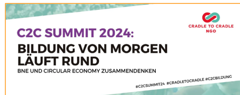
aktuelle Rahmen-

bedingungen und die Umsetzung von Bildung für nachhaltige Entwicklung (BNE) an Schulen. Beleuchtet werden auch methodische und inhaltliche Praxisbeispiele für Cradle to Cradle (C2C, Kreislaufwirtschaft) in Bildungseinrichtungen. Besprochen werden Aspekte wie gesunde Lernräume, Zukunftsberufe und Unterrichtsformen für den Wandel. Von 10:00 – 17:00 Uhr werden unter dem Motto “Bildung von morgen läuft rund” Bildung für nachhaltige Entwicklung und Circular Economy-Ansätze zusammengebracht. Die Teilnahme ist kostenfrei und als Fortbildung anerkannt. Weitere Informationen .