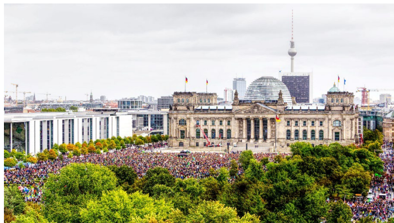
Großstreik am Bundestag am 24.9.21

Koordinierungsstelle Natur-, Umwelt- und Nachhaltigkeitsbildung Steglitz-Zehlendorf (NUN)