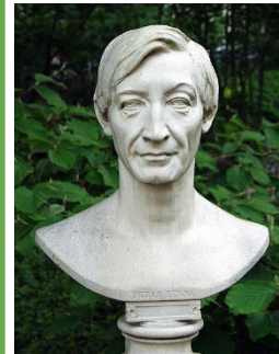
Lenné-Büste im Botanischen Garten Bonn; Bildquelle: Raimond Spekking / CC BY-SA 4.0 (via Wikimedia Commons)

Ende September feiert die Peter Lenné-Schule ihren Namensgeber Peter Joseph Lenné, der am 29. September 1789 in Bonn geboren wurde. Lenné prägte fast 50 Jahre lang die Gartenkunst in Preußen. Er gestaltete weit-räumige Parkanlagen nach dem Vorbild englischer Landschaftsgärten und konzentrierte sich auf eine sozialverträgliche Stadtplanung Berlins, indem er Grünanlagen für die Naherholung der Bevölkerung schuf. Der Schwerpunkt seiner Arbeiten lag im Berlin-Potsdamer Kulturraum, aber auch in vielen anderen Teilen Deutschlands lässt sich seine Arbeit bewundern. Mehr zur Feier erfahren Sie hier .