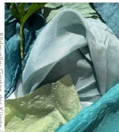
Bildquelle: Garten der Künste/

//Garten der Künste und UniGardening@SUSTAINIT!, Freie Universität Berlin