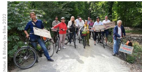
Natur & Bildung by Bike 2022

Die Koordinierungsstelle NUN lädt gemeinsam mit ihrem bezirklichen Bildungsbeirat Politiker:innen sowie Pressevertreter:innen erneut zur Veranstaltung „ Natur & Bildung by Bike “ ein. Am 1. September unternehmen sie gemeinsam eine Radtour durch die Bildungslandschaft des Bezirks und lernen grüne Lernorte und Bildungseinrichtungen kennen. Diese leisten wichtige Beiträge für den Bezirk, haben aber auch mit einigen Herausforderungen zu kämpfen. Mehr dazu erfahren die Teilnehmenden auf der Radtour, die von 14:00 bis 18:00 Uhr stattfindet.