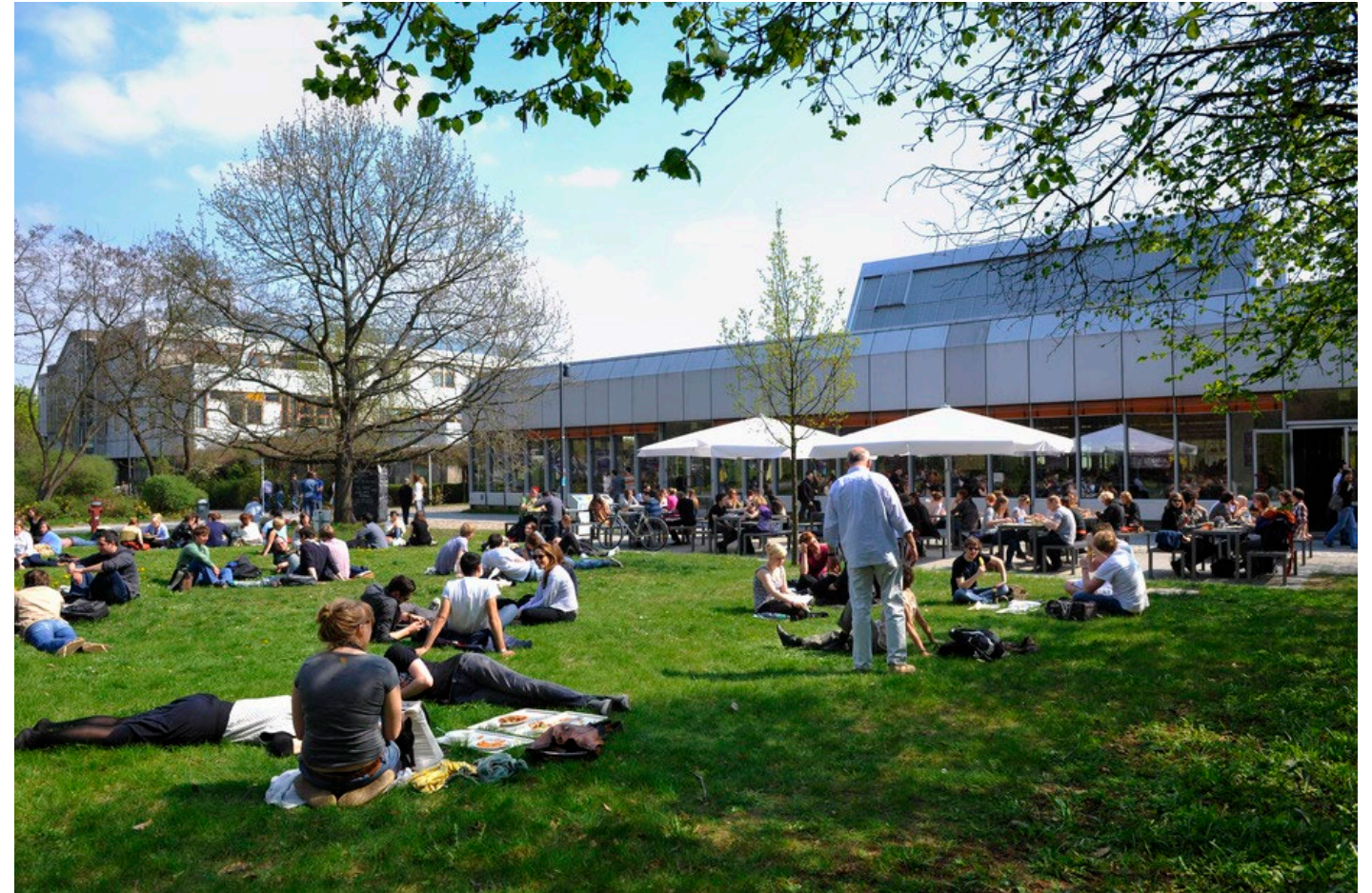
Campus Dahlem.