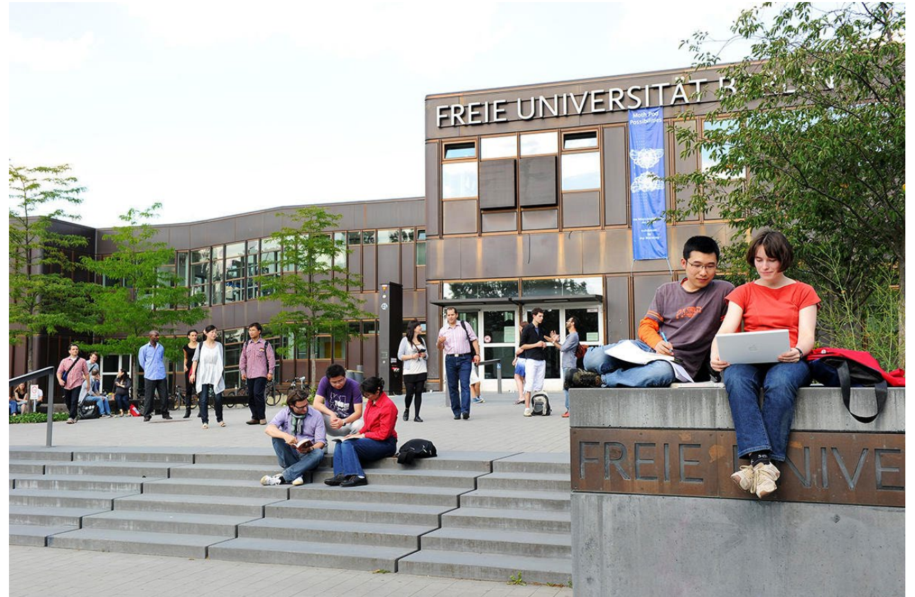
Haupteingang Rost- und Silberlaube.