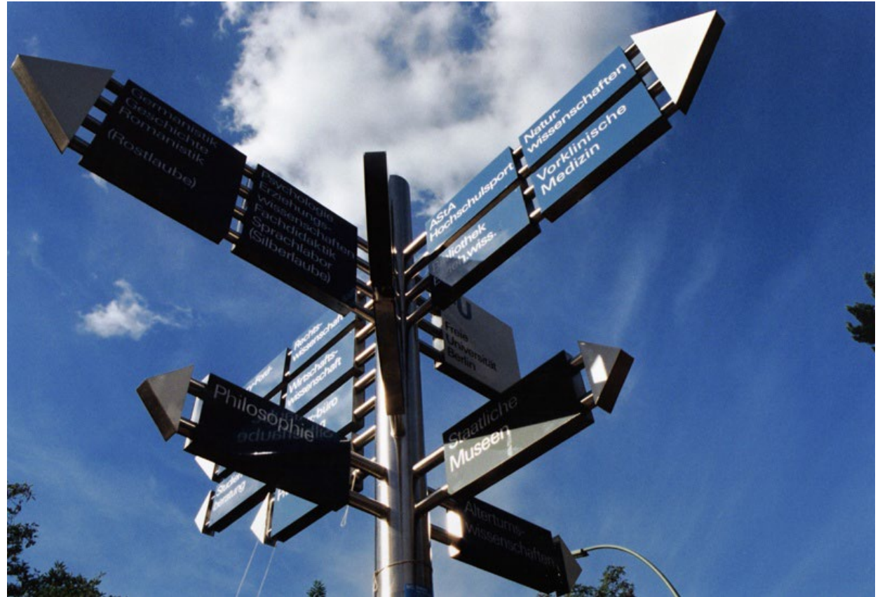
FU Wegweiser.

www.fu-berlin.de/sites/dse/studium/Studienstart/