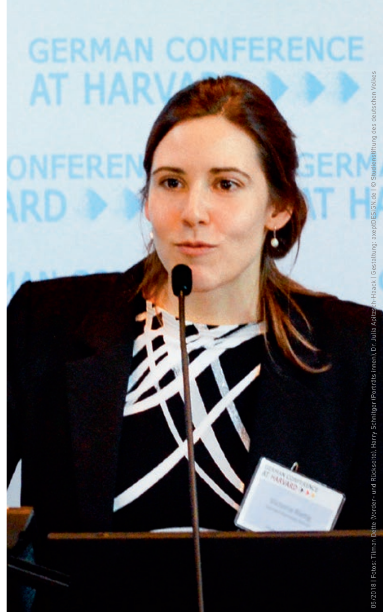
05/2018 | Gestaltung: avepDESIGN.de | © Studienstiftung des deutschen Volkes

Absolventen der Harvard Kennedy School bekommen Zugang zu einem globalen Netzwerk. Sie sind in führenden Positionen bei Regierungen, internationalen Organisationen, Think-Tanks sowie in der Wissenschaft oder Privatwirtschaft tätig. Was sie verbindet, ist das Bestreben, für den internationalen Dialog und die Veränderung der Gesellschaft einzutreten.