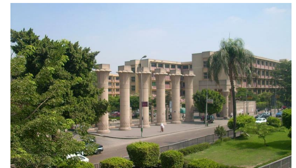
Ain Shams University Doors by Ashashyou

In Kairo und Umgebung finden das ganze Jahr über zahlreiche Feste und Veranstaltungen statt. Dazu gehören unter anderem im September das „Festival des experimentellen Theaters“, das „Wafa el Nil Festival“, ein großes Folklorefestival, sowie der „Welttourismustag“, eine Veranstaltung mit Musik und Ständen, auf der sich die Regionen Ägyptens vorstellen.