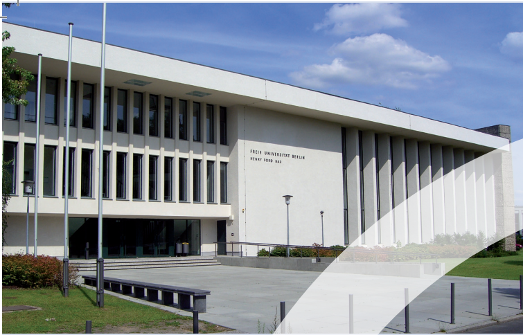
Henry-Ford-Bau | Garystraße 35 | 14195 Berlin-Dahlem