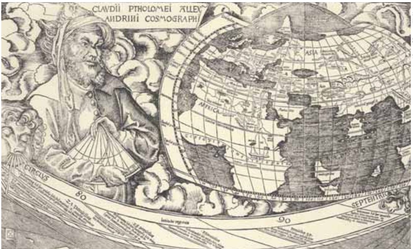
Library of Congress, Washington

Ptolemäus ist auf der Wandkarte von Waldseemüller mit einem typischen Werkzeug der Kartographen abgebildet, dem Winkelmesser.