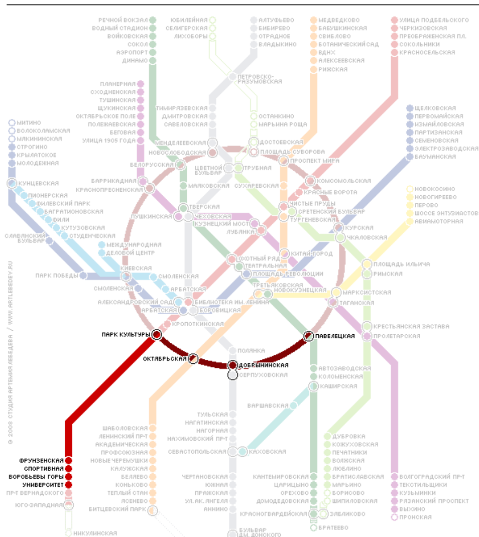
СХЕМА ЛИНИЙ МОСКОВСКОГО МЕТРОПОЛИТЕНА