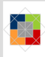
Promotion an der Berlin Graduate School Muslim Cultures and Societies