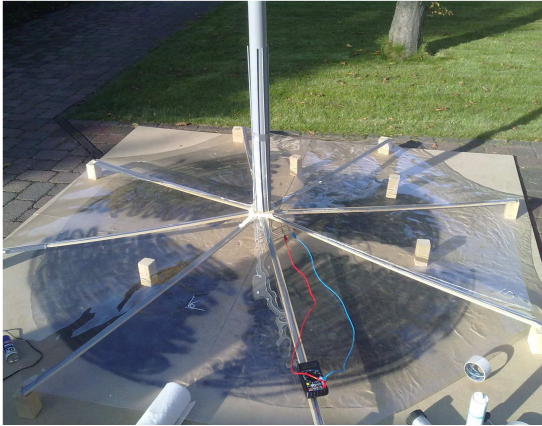
Siegerarbeit 2011 im Fach Physik: Konstruktion eines Aufwindkraftwerks

Freie Universität Berlin Fachbereich Physik – Didaktik Zentrum für Schulkooperationen Dr. Hans Riegel-Fachpreise Arnimallee 14 14195 Berlin