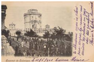
Der „weiße Turm“ auf einer Postkarte von ca. 1900