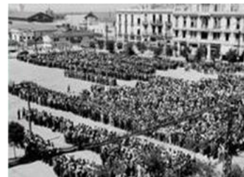
Samstag, 11. Juli 1942: Jüdische Bürger Salonikis zwischen 18 und 45 Jahren, müssen sich auf der Piazza Eleftheris um 15 Uhr einfinden.

In der Zeit vom 10. Mai bis 4. Juli 2014 zeigt die Universitätsbibliothek die Gedenkausstellung: „'Madre d'Israel' – Die sephardisch-jüdische Kultur Thessalonikis. 70 Jahre nach den Deportationen“.