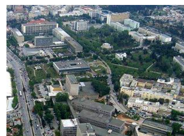
Thessaloniki – rechts im Bild der Unicampus auf dem Boden des alten jüdischen Friedhofs. ( http://www.nrh2.de/flyer/beitrag.php?id=12112&css=print , Abruf 14.05.2014)

Marie-Louise Motesiczky, Porträt Elias Canetti. London 1960. Öl auf Leinwand. Wien Museum