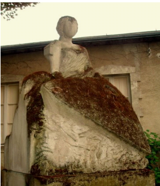
Urgestein freier Gleichheit? Namenlose Statue in La Châtre, der Stadt von George Sand

Aus einem Abstand von mehreren Jahrzehnten sind die Diskontinuitäten oder „Wellen“ des neueren Feminismus längst Gegenstand zahlreicher Rekonstruktionen. 2 Auch im Rückblick stellt sich indes die Frage, welches Bewusstsein und praktische Wissen aus der Arbeit der Rekonstruktion für die Zukunft folgt. Mein Beitrag wird auf diese Frage eine provokante Antwort geben, indem er das Marxzitat strategisch verkehrt. Marx ging davon aus, dass „die Welt längst den Traum von einer Sache besitzt, von der sie nur das Bewusstsein besitzen muss, um sie wirklich zu besitzen“. Ich gebe zu bedenken, ob viele unserer Probleme heute nicht daher rühren, dass uns die Visionen abhanden kamen. Ohne Wissen und Bewusstsein wird zwar kein, auch kein feministischer Traum Wirklichkeit, aber Wissen ohne Träume bringt die Welt auch nicht voran. Um dieser These empirisch begründet nachgehen zu können, rekonstruiere ich im Folgenden den Feminismus anhand seiner Träume von der