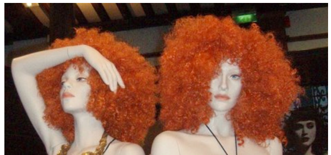
Freiheit für alle? Modepuppen im Londoner Liberty