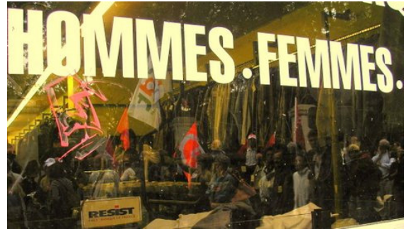
Spiegelbilder des Widerstands, Montpellier