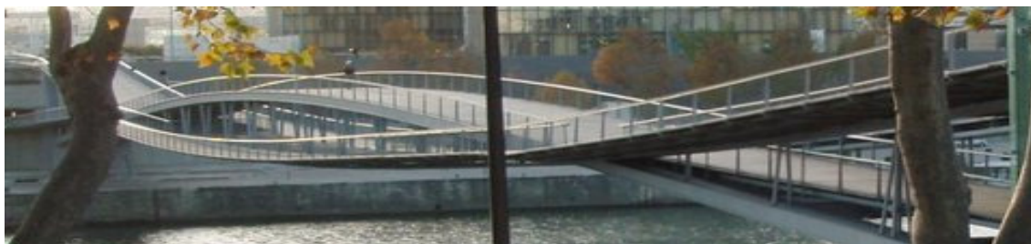
„La passerelle Simone de Beauvoir“, Brücke über die Seine vor der Nationalbibliothek in Paris

Ausgangspunkt meiner Rekonstruktion ist das Jahr 1968 als kulturelle Zäsur, die für den Erfolg des Feminismus maßgeblich war, auch wenn die Geschichte des Feminismus und seiner Träume viel früher beginnt. Erst 1968 führt nach bleiernen Jahren der Restauration allmählich an diese Vorgeschichte heran. Der neuere Feminismus startet im Aufbruchsoptimismus . Nicht schon ein Wissen und schon gar nicht ein beruflich verwertbares Wissen,