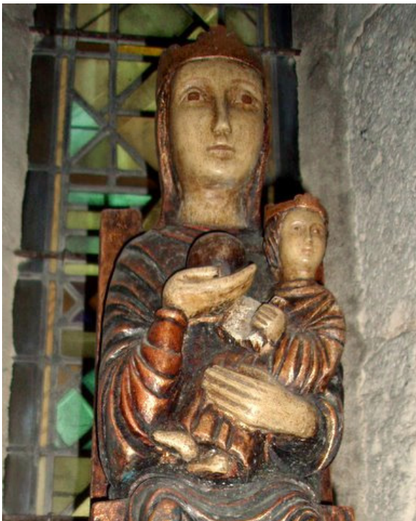
Der ursprüngliche Referenzpunkt? Abbaye von Chancelade

Dabei unterstellen die Differenztheoretikerinnen durchaus Unterschiede zwischen Frauen. Eine der wichtigen Schriften von Irigaray, Das Geschlecht das nicht eins ist , peilt im Selbstfindungsprozess von Frauen den Bewusstseinspunkt an, „niemals einfach nur eine zu sein“. Fraussein heißt „immer mehrere bleiben“, das gilt auch und erst recht für mehrere Frauen. 22 Die italienischen Differenztheoretikerinnen nennen „die Erkenntnis, dass wir nicht alle gleich sind“, einen ganz entscheidenden Schritt. Aber diesem Schritt soll ein zweiter identifizierender Bewusstseinschritt folgen, der alle Frauen am ursprünglichen Referenzpunkt der sexuellen Differenz vereint.