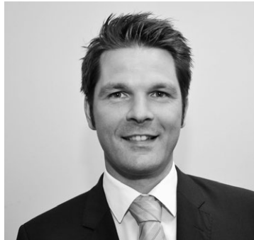
Steffen Krach Staatssekretär für Wissenschaft