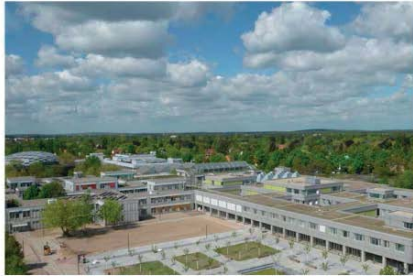
Die Dahlem School of Education (DSE) organisiert und koordiniert die praxis- und forschungsorientierte Lehrkräftebildung an der Freien Universität

Die Dahlem School of Education (DSE) organisiert und koordiniert die Lehrkräftebildung an der Freien Universität und löst darin das Zentrum für Lehrerbildung (ZL) ab.