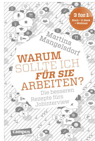
Rezension: Warum sollte ich für Sie arbeiten?