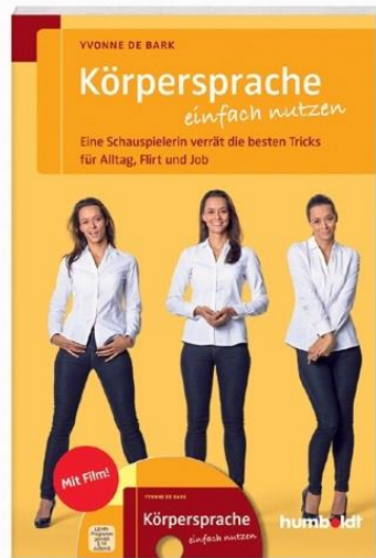
Rezension: Körpersprache einfach nutzen