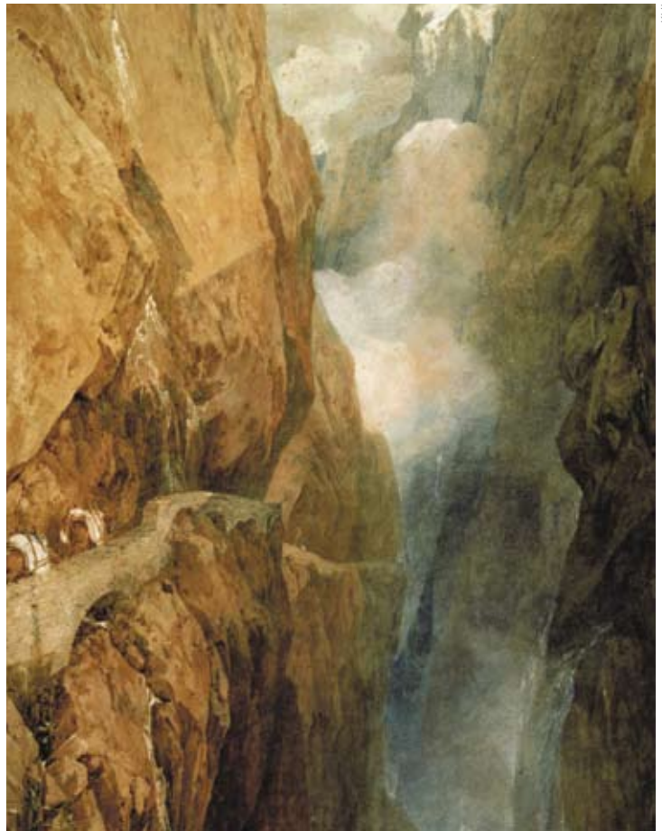
Schon William Turner prägte mit seinen Gemälden – hier der Gotthardpass – den touristischen Blick. Aquarell aus dem Jahr 1804.

Die Maslow'sche Bedürfnispyramide – entwickelt vom US-amerikanischen Psychologen Abraham Maslow – bietet ausreichend Spielraum für verschiedene Interpretationen. Während die Urlaubsreise als sogenanntes Entwicklungsbedürfnis am ehesten in der obersten Stufe der Pyramide, der Selbstverwirklichung, zu verorten ist, gehen andere Autoren davon aus, dass schon in der untersten Stufe, nämlich bei den Grundbedürfnissen, primitive Massenreisen befriedigt werden können – sprich: Angebote mit bequemer Unterkunft und einfacher Verpflegung. In der zweiten Stufe, der Befriedigung der Sicherheitsbedürfnisse, werden Reisen zur Regeneration und zur Kur verankert, bei den sozialen Bedürfnissen lassen sich Reisen mit dem Ziel, „Kontakte zu anderen Menschen herzustellen“, unterbringen. Bei den Bedürfnissen nach der Wertschätzung kommt wiederum Reisen als Prestige und Anerkennung zum Ausdruck. Als alleiniges Erklärungsmodell taugt auch dieser Ansatz nicht, da nicht klar ist, warum sich gerade das Reisen als Massenphänomen entwickelt – und nicht andere Erlebnisbereiche. Vor allem angelsächsische Autoren ziehen Parallelen zwischen Tourismus und Pilgertum. Für den Soziologen und Autor Dean MacCannell spiegelt sich im Tou-