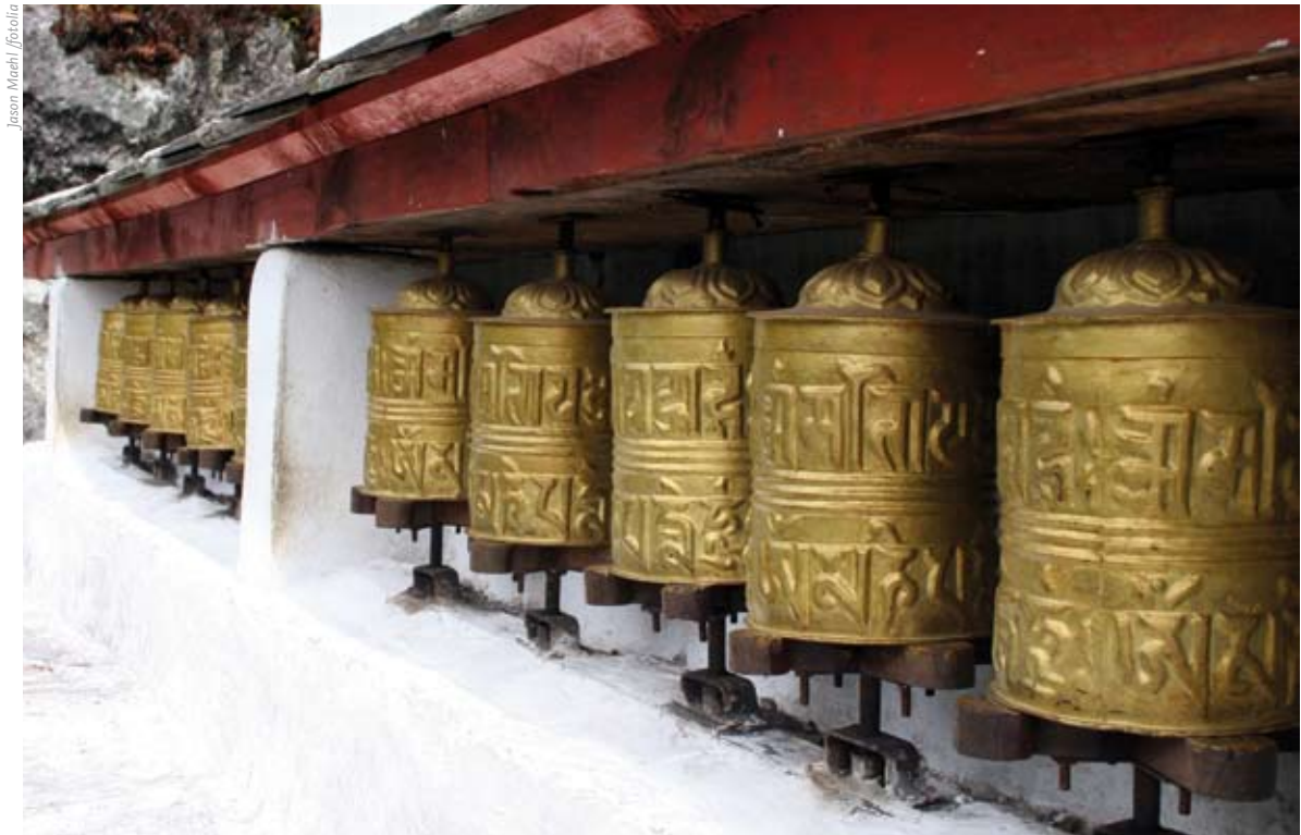
Touristen als moderne Pilger auf der Reise zu „sakralen“ Plätzen? Gebetsmühlen in Nepal.

dass „sich der Sieg des Tourismus als Pyrrhussieg“ erweist. „Die Flucht aus der industriellen Welt hat sich selbst als Industrie etabliert“. In diesem Zusammenhang spricht Enzensberger auch vom Tourismus als einer Industrie großen Stils, für die Normung, Montage und Serienfertigung unentbehrlich ist. Die Suche nach Freiheit betrachtet er als Massenbetrug: „Indem wir auf die Rückfahrkarte in unseren Taschen pochen, gestehen wir ein, dass Freiheit nicht unser Ziel ist, dass wir schon vergessen haben, was sie ist. Oder nach Weinin-