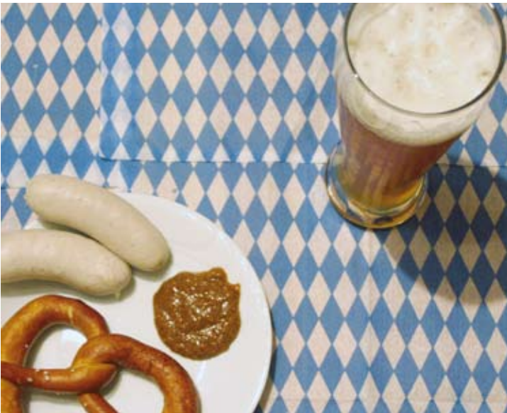
Nur knapp 30 Prozent der Haupturlaubsreisenden bleiben im Inland.

kraft“ oder – sozialistisch ausgedrückt – mit der „Reproduktion der Arbeitskraft“. Wieder andere reden vom Wander- und Reisetrieb oder von einem sogenannten Nomaden-Gen. Kulturwissenschaftler definieren Reisen als Flucht aus dem Alltag oder als Prestigekonsum, als Imitation, als Erfahrungskonsum: „Reisen zu imaginären und inszenierten Welten“.