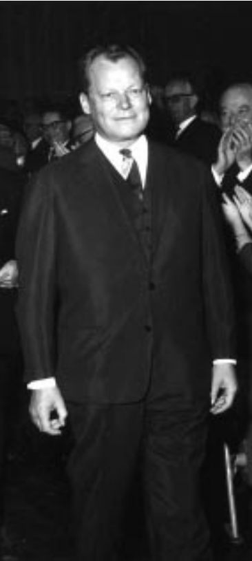
Robert F. Kennedy, der Regierende Bürgermeister von Berlin, Willy Brandt, sowie – dahinter – der damalige Senatssprecher Egon Bahr

The free way of life proposes ends – but it does not prescribe means. It assumes that people, and nations, will often think differently – and have the full right to do so – and that diversity is the source of progress. It believes that men advance by discussion, by debate, by trial and by error. It believes that the best