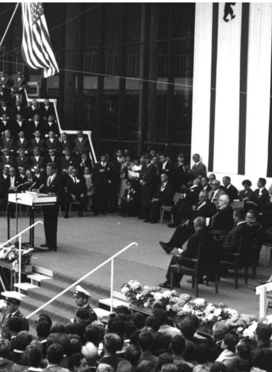
John F. Kennedy spricht vor der Freien Universität Berlin 1963